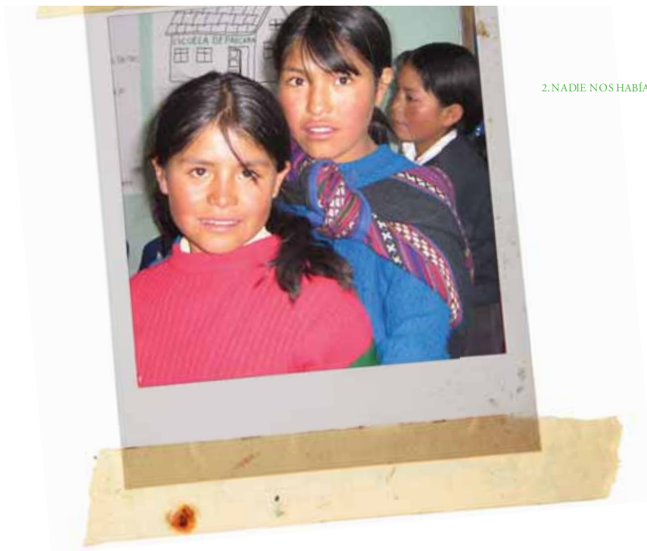
2. NADIE NOS HABÍA HABLADO ASÍ: APRENDIZAJES, CAMBIOS Y RETOS

y no voy a tener tiempo. Decía que venimos por gusto, para no ayudar a mi mamá. “Los dos”, le dije. Primero no me entendió nada y ahora me está entendiendo poco a poco que vengo a aprender.