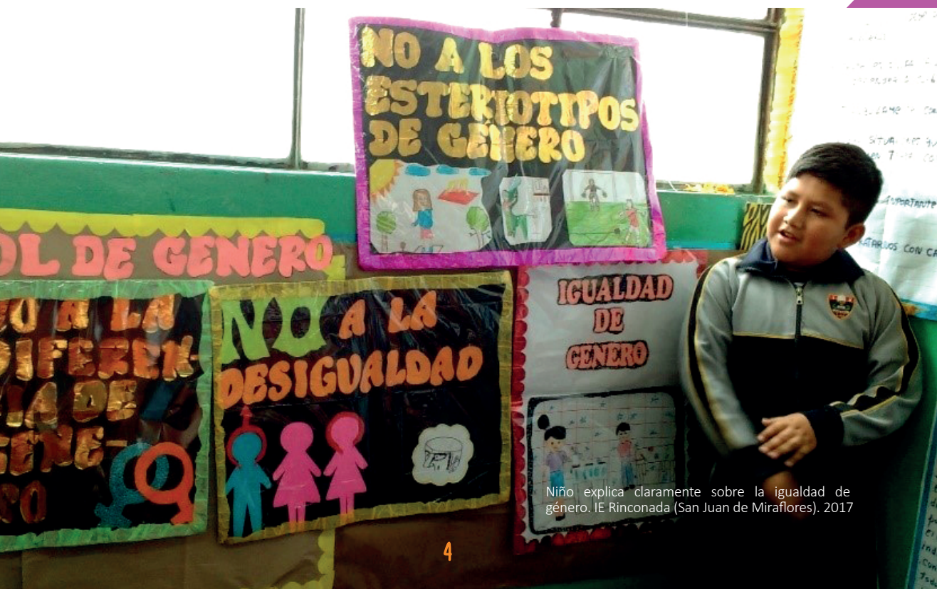
Niño explica claramente sobre la igualdad de género. IE Rinconada (San Juan de Miraflores). 2017

1 Porcentaje del total de adolescentes de 15 a 19 años de edad. Fuente: Instituto Nacional de Estadística e Informática - Encuesta Demográfica y de Salud Familiar. Perú Brechas de género 2017. INEI, Lima, setiembre 2017.