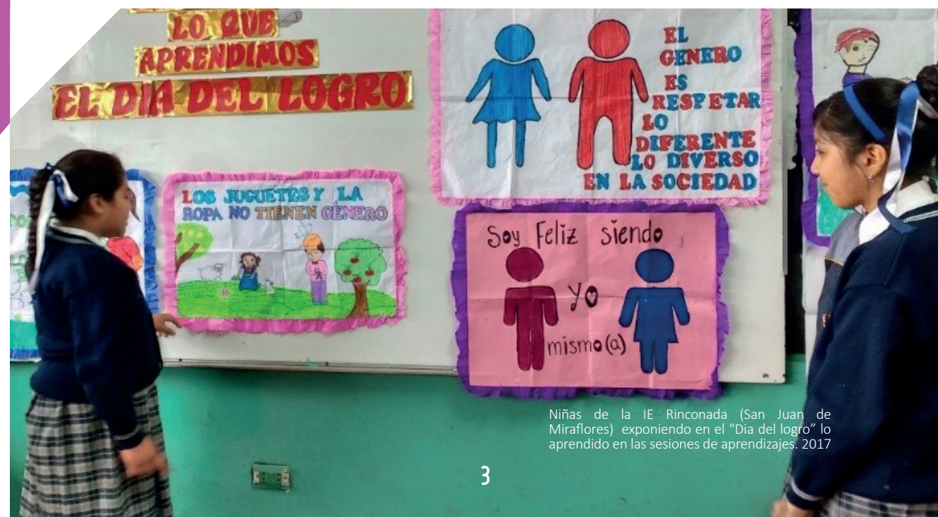
Niñas de la IE Rinconada (San Juan de Miraflores) exponiendo en el “Día del logro” lo aprendido en las sesiones de aprendizajes. 2017

En ese esfuerzo, nuestro equipo en las tres regiones y dependiendo de diversos factores políticos, institucionales, y de la apertura de las autoridades, docentes y padres/madres de familia, trabajó involucrando a las autoridades regionales y locales, sensibilizando, capacitando y brindando asistencia técnica al personal docente y directivo de las instituciones educativas; trabajando con padres, madres y personas cuidadoras informándoles sobre la importancia de la ESI y fortaleciendo sus capacidades para el diálogo, comunicación y relaciones igualitarias.